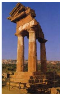
Collegio dei Geometri e Geometri Laureati Provincia di Agrigento